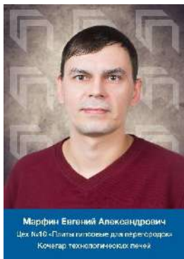
Морфин Евгений Александрович Цех №10 - Производство для переработки Конечар технологических печей